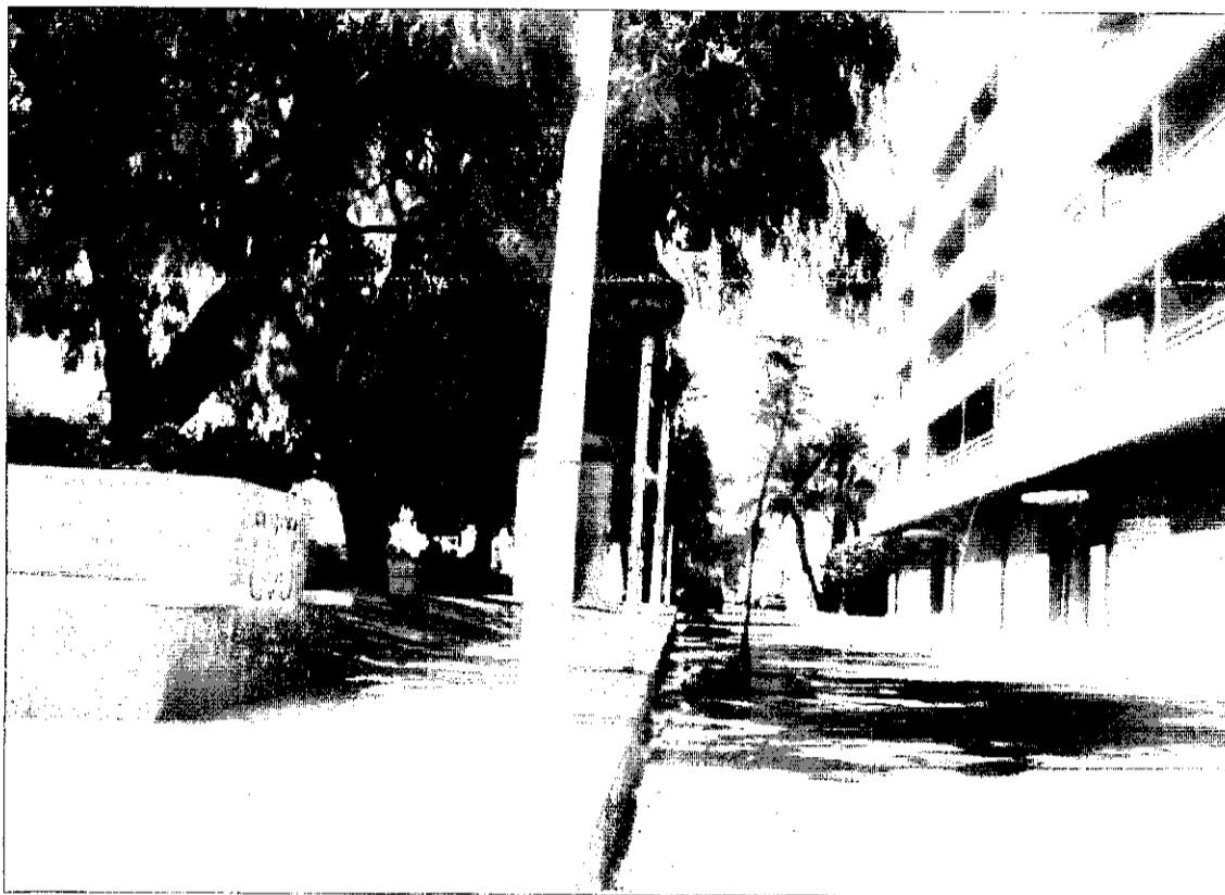
La població de Picanya té quasi 21 m 2 de superfície verda per habitant.

Picanya, amb 8.230 habitants, té una superfície verda construïda de 167.906 m 2 , és a dir, 20,98 m 2 per habitant i 61,2 m 2 per vivenda, xifra que supera el mínim de 15 m 2 per vivenda que exigeix la Llei del Sòl. Vint-i-dos parcs i jardins, i 13 carrers amb arbres al casc urbà, formen el pulmó verd del municipi. Però l'ajuntament, conscient que els arbres donen qualitat de vida, posarà en marxa un pla de plantació d'arbres als carrers que encara no en tenen.