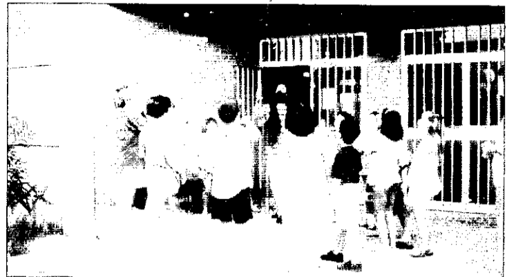
Participants en l'Escola Esportiva d'Estiu.

Els estudiants de Picanya i Panazol van aprofitar bé les seues vacances aprenent, jugant i practicant esport, acompanyats