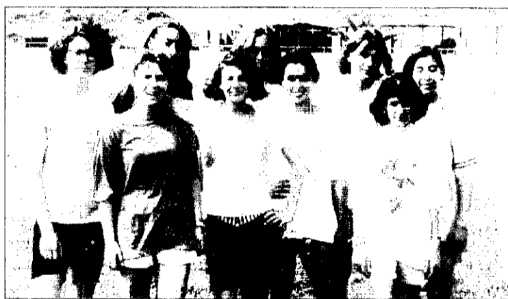
Escolares de Panazol en Picanya.

Según los organizadores, los objetivos del intercambio, entre los que destacan el conocimiento de la lengua y de los valores básicos de la convivencia, entre otros, han quedado totalmente cumplidos.