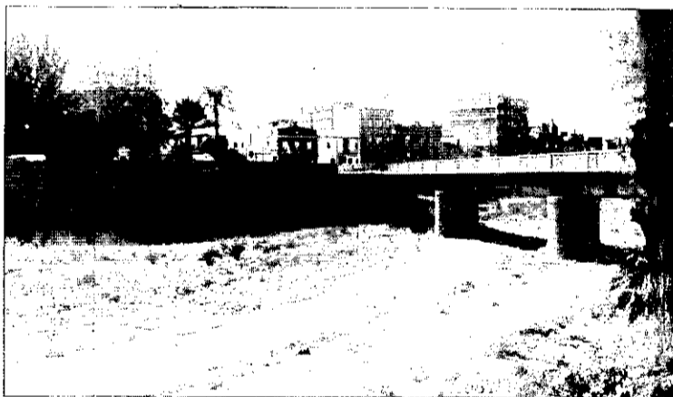
Barranco de Chiva a su paso por Picanya.

Picanya quedarà lliure en un futur pròxim del perill de las riadas por desbordamiento del barranco de Chiva, también llamado del Pollo o Torrent. La Confederación Hidrogràfica del Júcar, dependiente del Ministerio de Obras Públicas, ha redactado un proyecto de canalización del citado cauce y sus afluentes para eliminar el enorme poder de destrucción de las inundaciones en L'Horta Sud.