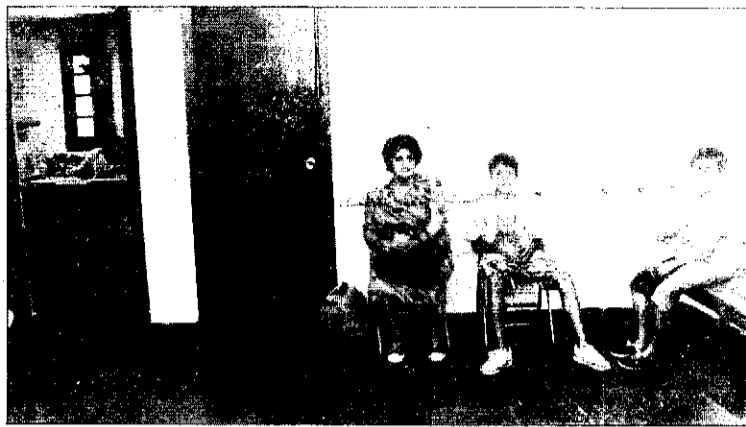
Centro de salud de Picanya.

El centro de salud de Picanya ha puesto en marcha este mes de septiembre un nuevo programa de salud, el de atención integral a la mujer climatérica, que se une a los programas de la mujer, niño sano y del adulto que ya se están desarrollando. En el nuevo programa se atenderá a las mujeres de 46 a 64 años, edad en la que se producen algunas enfermedades como consecuencia de la menopausia.