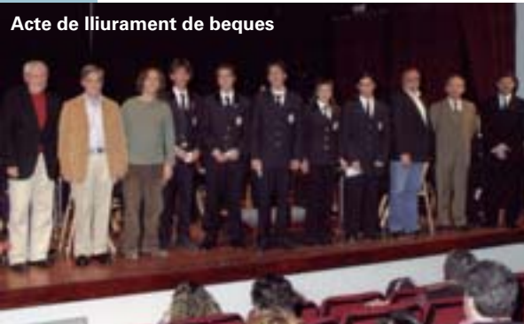
Acte de lliurament de beques

El passat 11 de març, la Unió Musical de Picanya va oferir un concert durant el qual es van lliurar aquestes beques. A l'acte de lliurament va assistir el director general de Fermax, qui va lliurar els xecs als guanyadors.