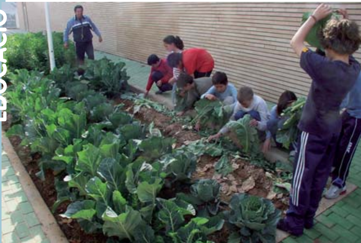
Treball a l'hort escolar