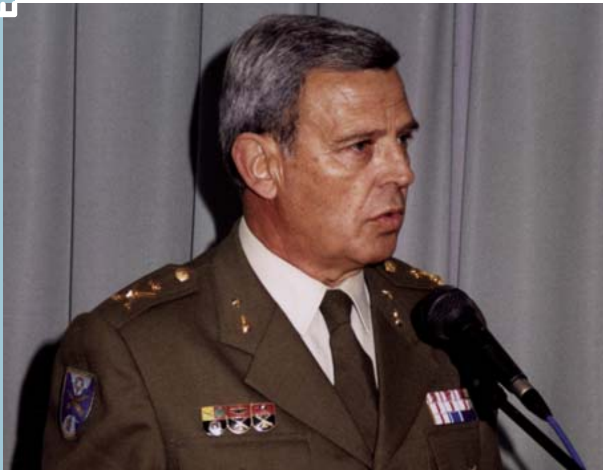
Justo Ruiz, General del Ejército. Gobernador Militar del Campo de Gibraltar

Justo Ruiz, actual Gobernador Militar del Campo de Gibraltar