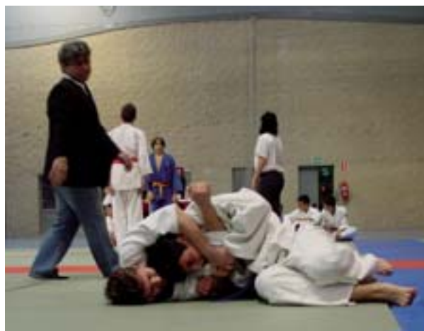
Els judokes en un moment de la competició

Les places per a aquestes activitats són limitades i per a inscriure-s'hi i obtenir-ne més informació cal adreçar-se al Centre d'Informació i Gestió de l'Ajuntament (9.00h a 21.00h de dilluns a dissabte).