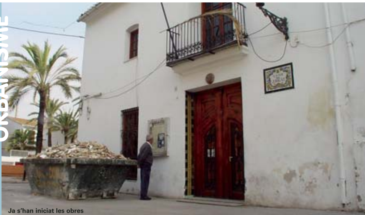
Ja s'han iniciat les obres