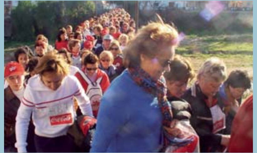
Participants del Recreo-Cross