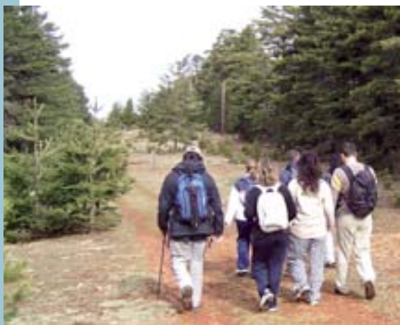
Excursió per Valdelinares

taula i la pilota valenciana. El dia 2 es disputaran les finals d'aquestes modalitats. Però el moment més important de la Setmana Esportiva és la celebració dels Jocs d'atletisme, al Poliesportiu Municipal. Aquesta matinal esportiva se celebrarà el dissabte 3 de juny. El ritme d'aquesta competició és frenètic, ja que se succeeixen una darrere l'altra les diferents proves, les curses de velocitat, de resistència, els salts, etc. El diumenge 4 de juny finalitzaran les competicions d'aquesta Setmana Esportiva, amb la final de tennis al poliesportiu.