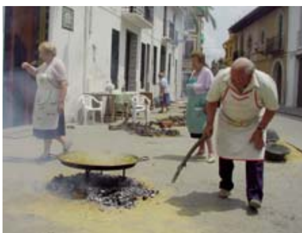
Festival de paelles

D'altra banda el Consell també ha fet públiques les bases per al suport a programes d'ONGs. El pressupost destinat és de 24.000 euros i el termini de presentació de projectes finalitza el 31 de maig. El text íntegre de les bases pot consultar-se en el web municipal: www.ajuntament.picanya.org