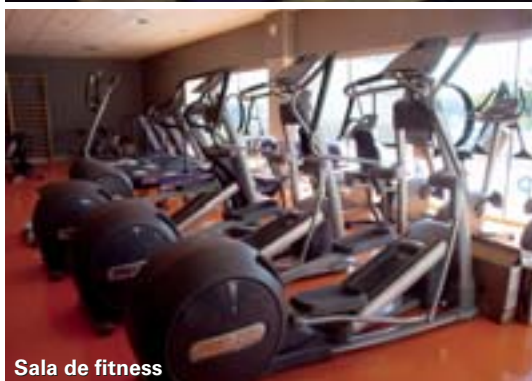
Sala de fitness