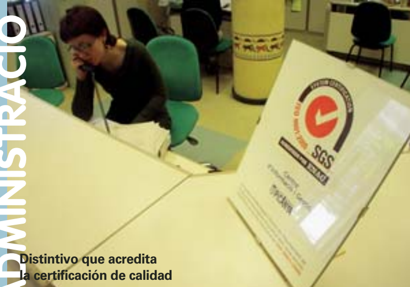
Distintivo que acredita la certificación de calidad

Trobada d'Escoles en valencià a l'any 2004 o l'organització del programa de parelles lingüístiques que al nostre poble tingué una important acceptació, i que consistia a reunir dues persones, una valencianoparlant i l'altra no per a afavorir la conversa en valencià i aconseguir donar eixe primer pas fonamental i que de vegades resulta el més difícil.