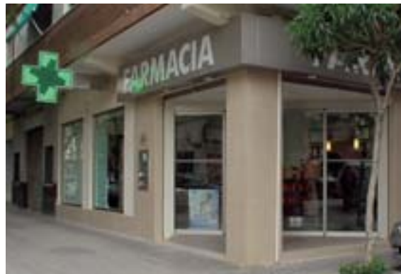
Nova farmàcia al C/ Sant Joan Baptista