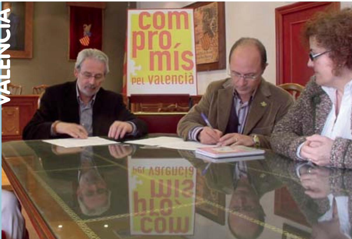
Acte de signatura de l'acord