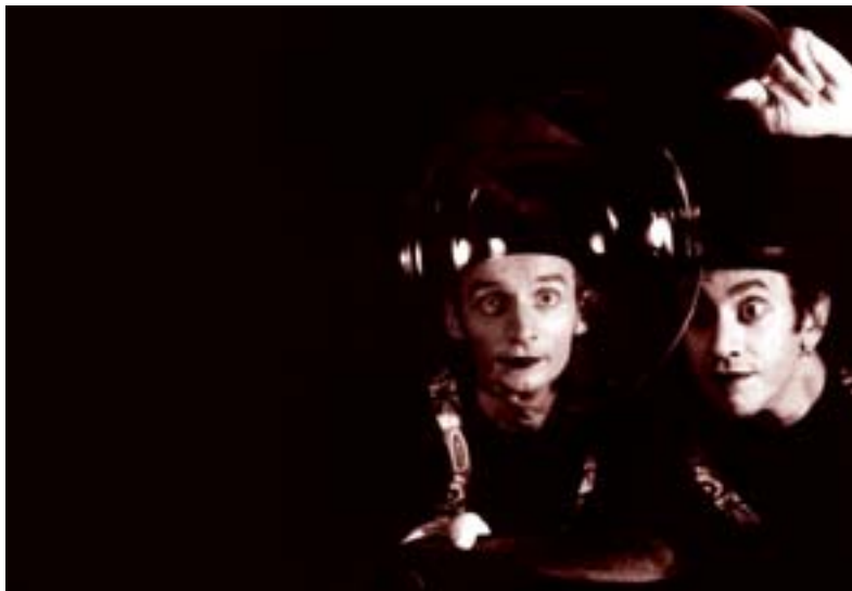
"El Negro y el Flaco" ens porten Giramondo