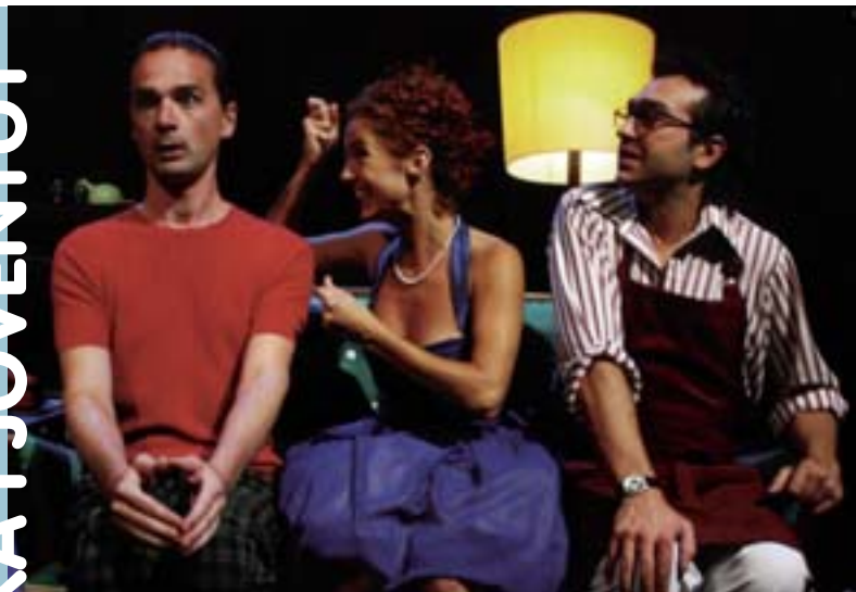
Un moment de Teràpies