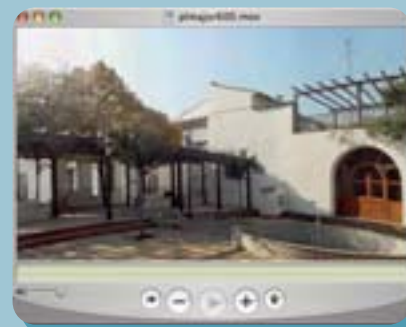
Fotografia "navegable" en format circular

L'aplicació permet, per mitjà d'un senzill menú, accedir a tot un seguit de fitxes on es poden trobar fotografies de cada espècie (amb una completa visió de la planta en la seua localització a Picanya i amb una imatge de detall de les fulles i dels fruits) amb el nom comú de la planta (en valencià i castellà) el nom científic (espècie, subespècie i família) així com l'hàbitat natural de procedència (amb un mapa del món amb la localització), les peculiaritats i l'indret on podem descobrir-la als nostres carrers. Per últim, un submenú ens ofereix detalls sobre les fulles, les flors i els fruits, unes dades, sovint fonamentals, per a identificar correctament cada planta.