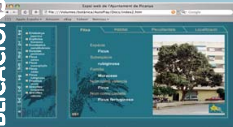
Aspecte de la Guia