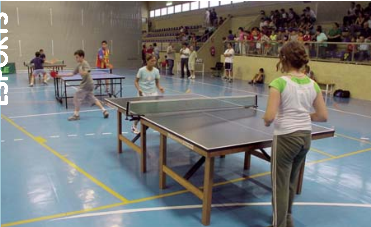
Tennis de taula en la darrera edició de la Setmana Esportiva