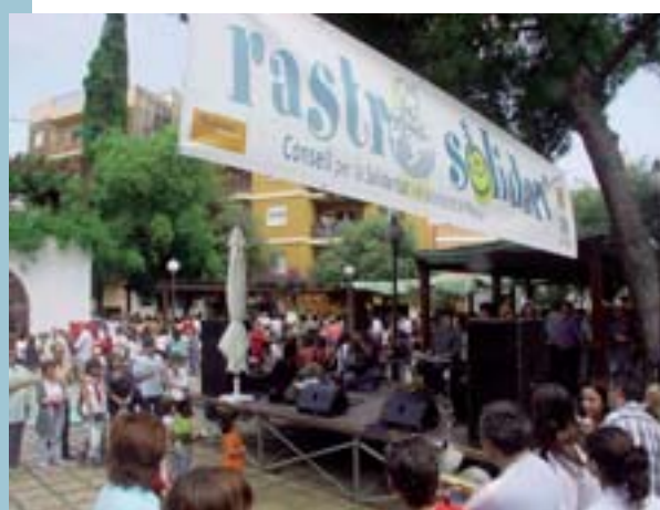
Imatge del "Rastro" 2005

El Ayuntamiento de Picanya sigue siendo pionero en certificación de la calidad de los servicios, ya que es uno de los ayuntamientos con mayor número de actividades y servicios certificados a nivel nacional.