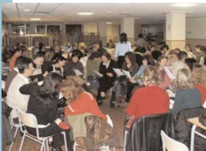
Anterior xerrada sobre disciplina familiar

L'AMPA de l'IES Enric Valor continua amb el seu programa de xerrades formatives