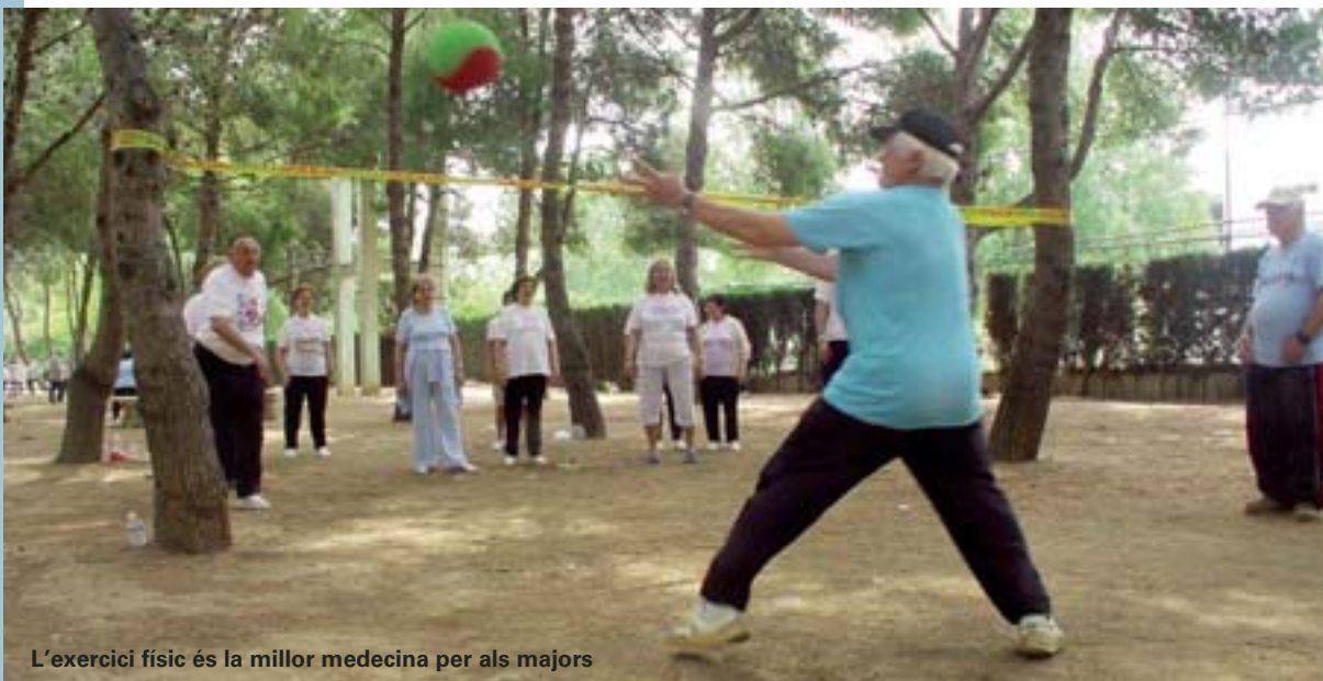
L'exercici físic és la millor medecina per als majors

Està previst que aquestes obres finalitzen en uns quatre mesos. Quan acaben la Llar del Jubilat serà molt més còmoda per als seus usuaris i usuàries.