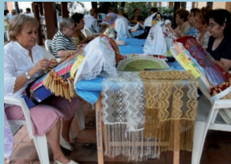
Boixeteres a la plaça Major

El Centre té previst enguany la matriculació de més de 500 alumnes entre cursos i tallers. Una xifra que situa l'EPA de Picanya entre les de major nombre d'alumnes a la nostra comarca.