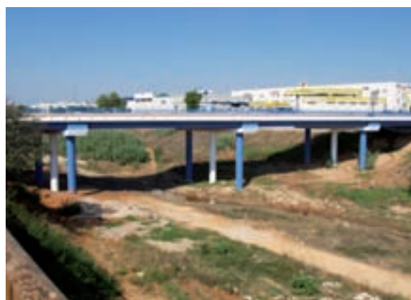
Nova pintura per al pont

Una vegada finalitzen les obres, Picanya disposarà d'un modern Centre de Salut de vora mil metres quadrats, dotat de nou consultes de medicina general, de tres de pediatria, de quatre sales d'infermeria, i d'una sala d'extraccions. A més a més, hi haurà una consulta i un gimnàs per al treball de la matrona.