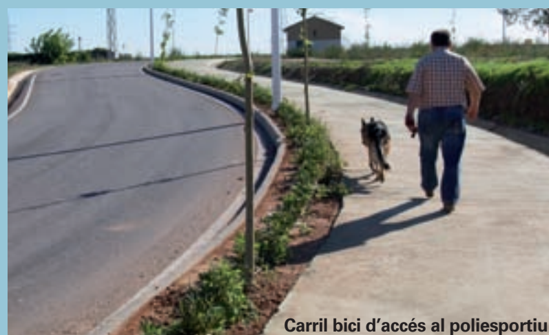
Carril bici d'accés al poliesportiu

L'Ajuntament de Picanya ha expropiat una casa al carrer Almassereta per a millorar l'accés de les persones al Polígon de Raga. Als terrenys que ara ocupa aquesta casa s'ha construït una escala que connecta els carrers Almassereta i Azorín. D'aquesta manera, s'obri l'accés directe des de la passarel·la que hi ha darrere del Mercat Municipal fins al polígon. Això facilitarà l'accés al seu lloc de treball a tots aquells veïns de Picanya que hi treballen al Polígon de Raga amb un especial aprofitament per a les dones que treballen als magatzems de taronja cosa que suposarà una important millora en el seu anar i tornar diari.