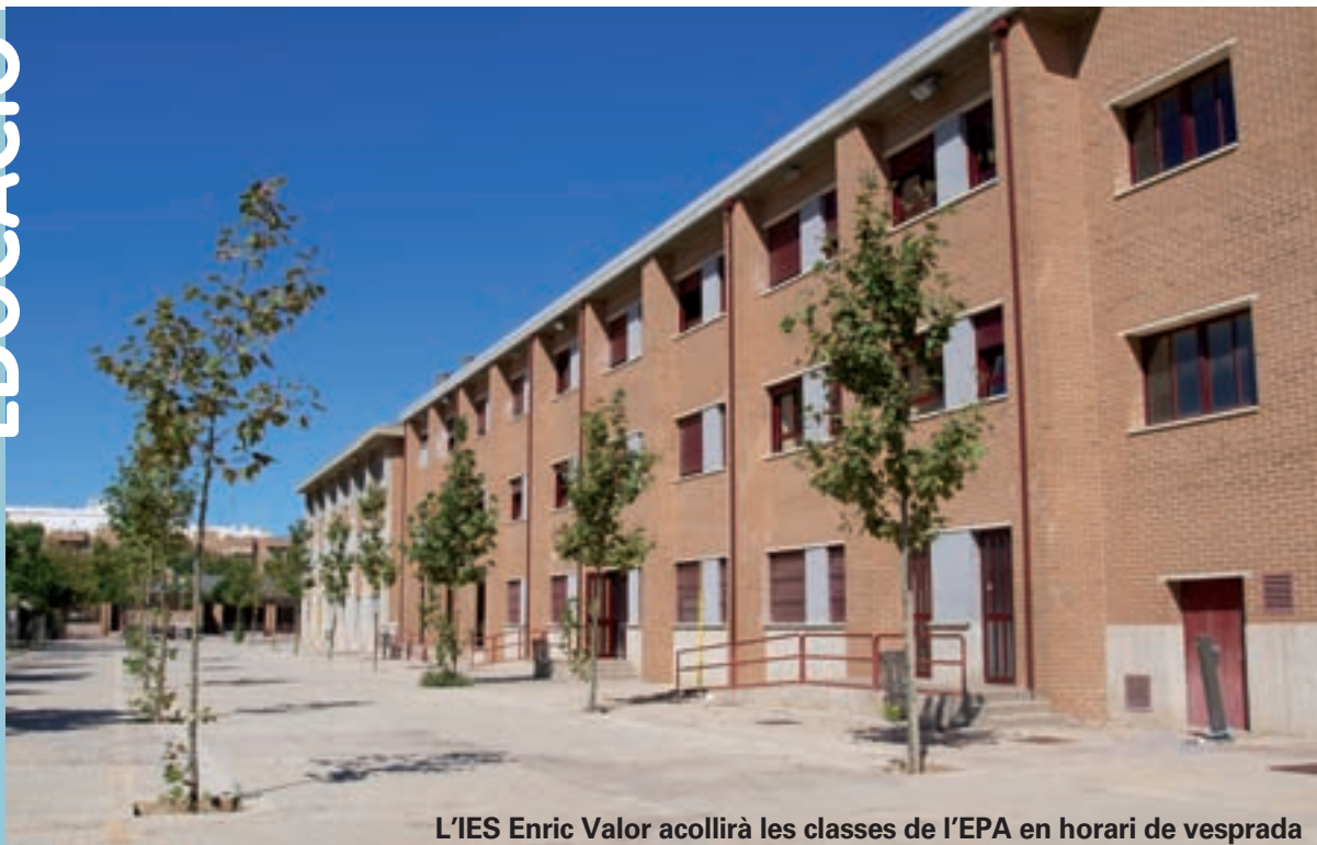
L'IES Enric Valor acollirà les classes de l'EPA en horari de vesprada