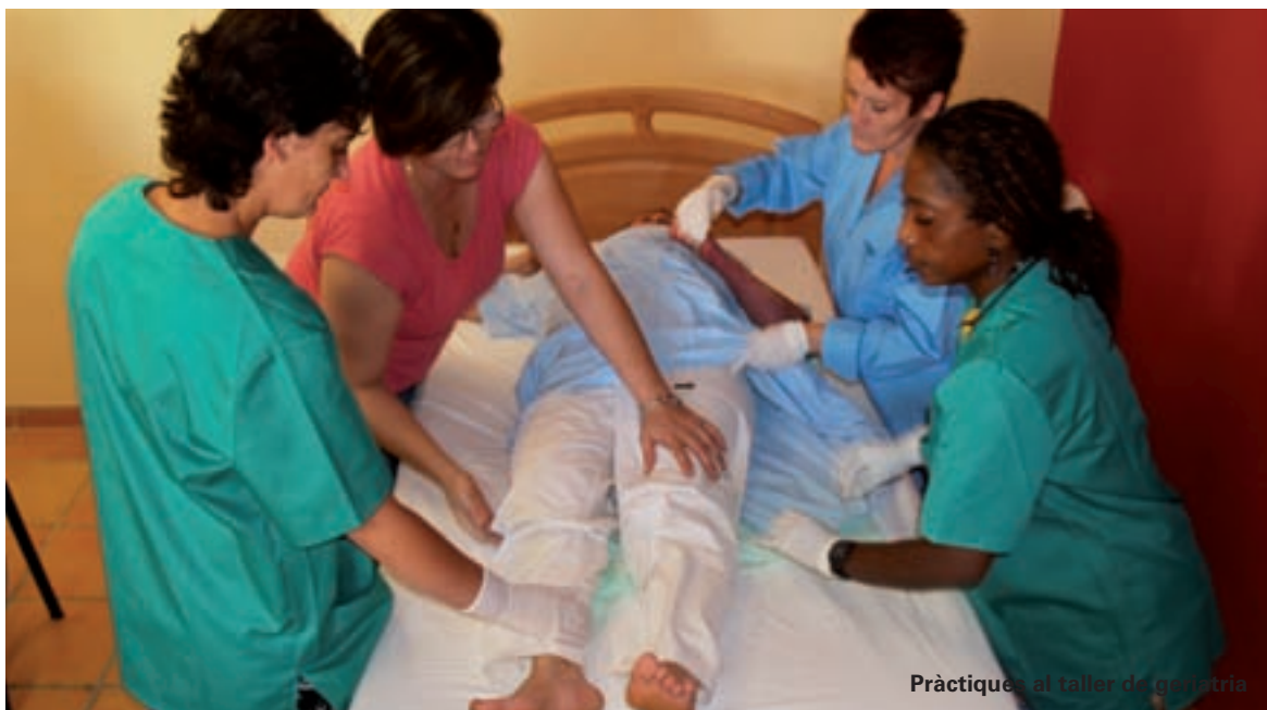
Pràctiques al taller de geriatria

Al nostre poble, en el Centre Cultural de Picanya, s'acollirà, en sessió oberta al públic, una projecció d'aquest documental el 18 d'octubre. Una gran oportunitat per conèixer de forma detallada i documentada la realitat d'un esdeveniment històric al nostre municipi.