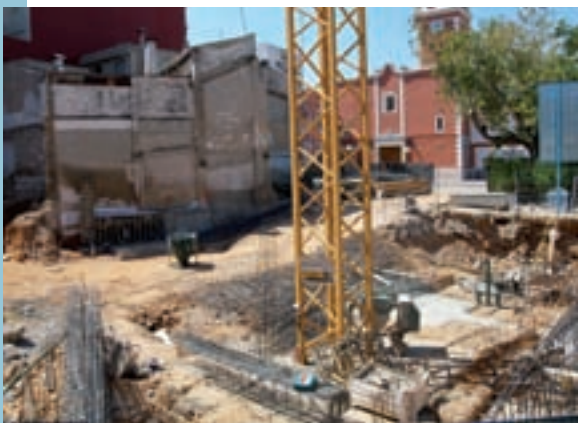
Obres del Centre de Salut

serveix per a enfortir el canell i l'avantbraç. També per a exercitar el gir del canell, hi ha un aparell que disposa d'un disc giratori i d'una hèlix. L'última és un gran roda, serveix per a exercitar el gir dels braços i millorar les articulacions dels múscles. Per tal d'exercitar les cames, també s'hi ha instal·lat un banc amb pedals amb capacitat per a dues persones.