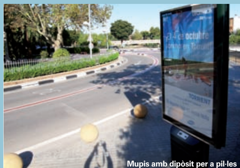
Mupis amb dipòsit per a pil·les

Recentment s'ha realitzat una plantació d'arbres i arbusts a la jardineria que separa el carril bici del camí que va cap al Poliesportiu de Picanya. S'ha plantat una alineació de pittosporum tobira , un arbust molt resistent a la sequera i al fred que es pot retallar per a fer una tanca lineal. També s'han plantat arbres de l'espècie plàtan d'ombra, que serviran per a fer més agradable el passeig fins el Poliesportiu. En tota la zona que ha estat plantada s'ha instal·lat també el reg per degoteig per tal d'aprofitar al màxim els recursos, a l'hora que es conserva la vegetació i racionalitzar el consum d'aigua.