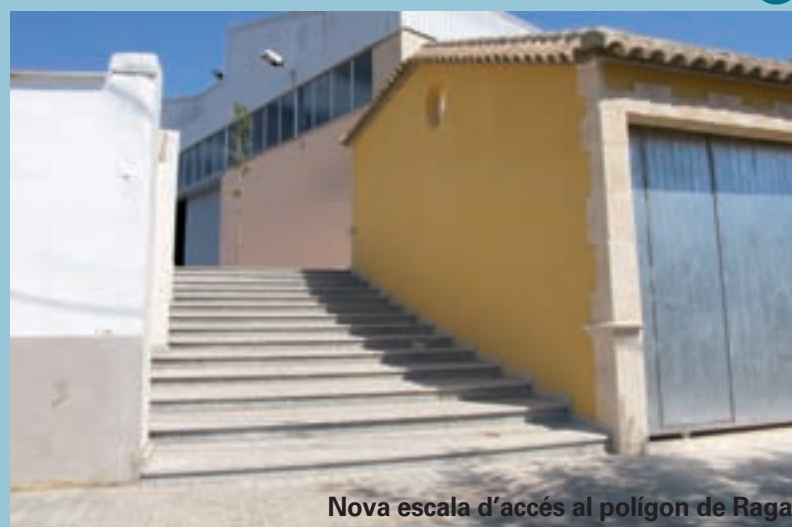
Nova escala d'accés al polígon de Raga

Amb aquestes dues intervencions es continua el procés de restauració i pintura dels tres ponts i dues passarel·les que creuen el barranc en un procés que, a més de les qüestions de manteniment, ha valorat l'embelliment d'aquestes infraestructures com a una forma de millora de l'entorn i on l'habitual gris-formigó ha donat pas a tot un ventall de colors.