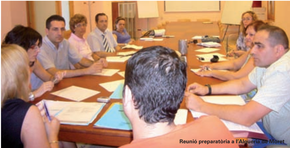
Reunió preparatòria a l'Alqueria de Moret