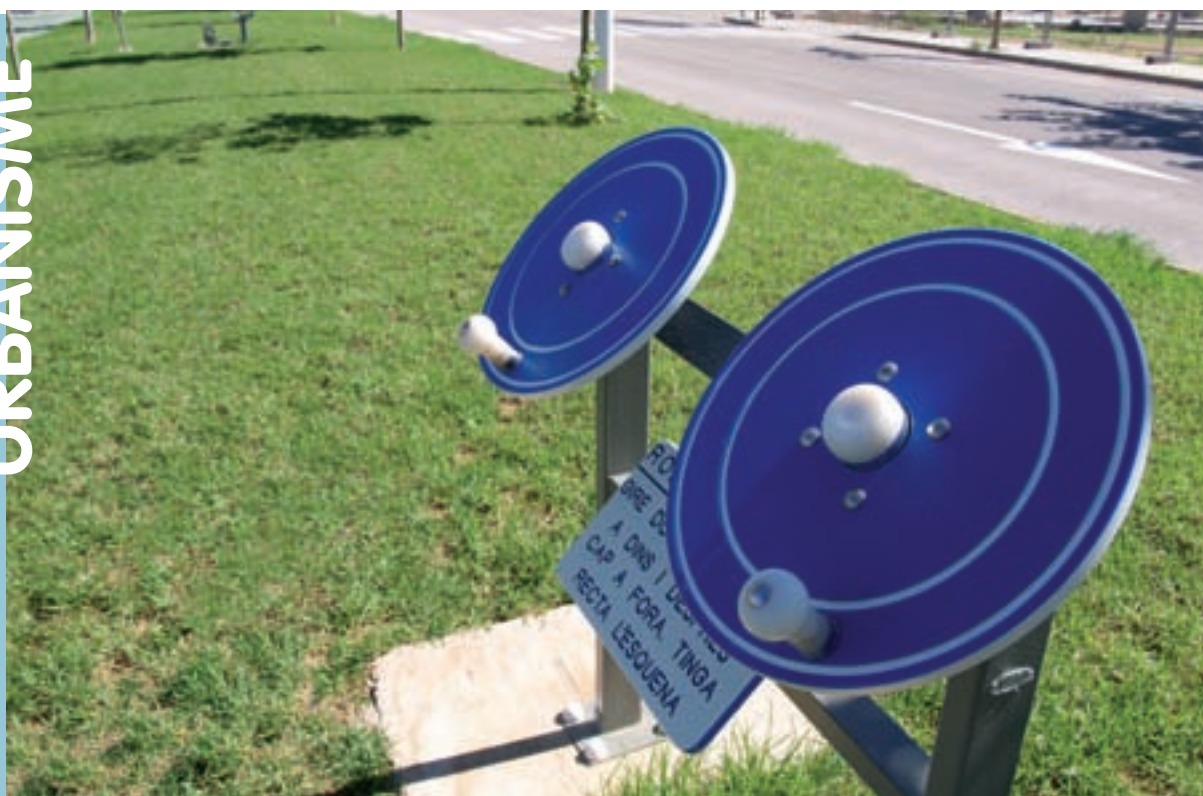
Nou conjunt d'aparells